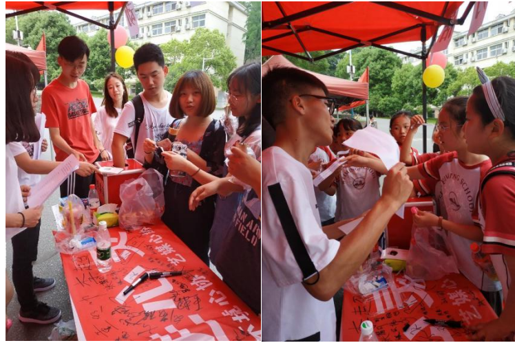
图4 同学们积极参加“心理知识问答”赢得奖品

在心理知识问答的环节中,不少路过的同学通过随机抽取相应的心理知识问题进行回答,在回答问题的同时还能在工作人员的帮助下了解了一些趣味的心理小知识。本次的心理知识问答也是意在希望通过趣味问答的方式来增加同学们对心理健康知识的了解度。在活动的现场,我们还设置了心理健康月的横幅,让各位师生前来签名,提高人们对心理健康的关注,活动的现场,连不少校外的小学生也积极地前来参与,场面十分热闹。家长也对签名活动表示十分赞成并在横幅上签上了自己的名字。