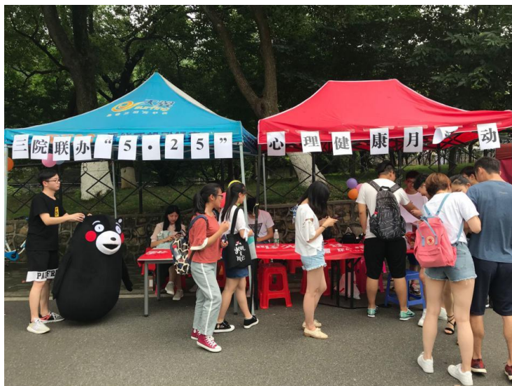
图 5 活动现场图片

本次心理健康月系列活动通过线上与线下的结合，将心理健康融入到同学们的生活中，通过笑脸传播、趣味问答等方式增加了同学们对心理健康的关注度，提高人们对大学生心理健康的认识。