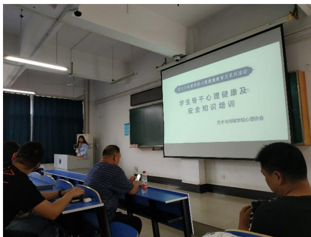
图 6 学生骨干心理健康及安全知识讲座培训现场

5月24日下午2:30，艺术与传媒学院心理健康讲座与安全讲座于在北综307举行，全体本科生班长、团支书、心理委员、安全委员及部分班主任会参加了本次讲座培训。