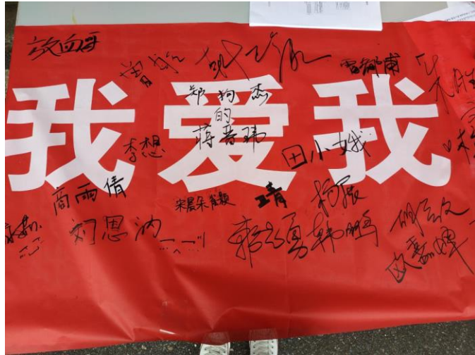
图2 心理健康月活动签名

“笑脸征集”：心理健康月系列活动中，首先进行的是线上的“笑脸征集”活动。经过前期的投稿征集，我们收到了不少充满着阳光笑脸的照片，照片中都透露着同学们的青春与活力。而经过第一轮院内评比，三个学院各选出了六张照片进入了第二轮的三院评比中。通过线上的统一投票来选出最终的前三名。“笑脸征集”活动意在通过展现各自的笑脸，引导同学们微笑面对生活，保持健康的心理状态。