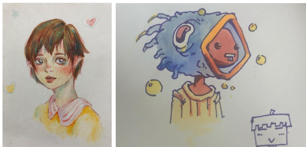
图1 部分同学在活动中的绘画作品

本次的“抒情画意”涂鸦活动主旨是让同学在绘画中表达自己内心的情感，通过涂鸦认识到自己。在活动的过程中，我们设置了一些绘画的主题，也可让参与的同学自由发挥。不少同学参与到其中，尽管最初对自己想要画什么有些迷茫，但在工作人员的指引下还是动手画出了心中所想，摊位中也留下了不少同学们的作品。“认识自我，才能更好地爱自己”，涂鸦活动中所希望传达的便是让同学们更好地认识自己，了解自己。虽然同学们留下的一幅幅画作并不一定是最完美的，但却是表达了各自内心情感的。本次活动也从有趣轻松的方式让同学们更好地了解自己。